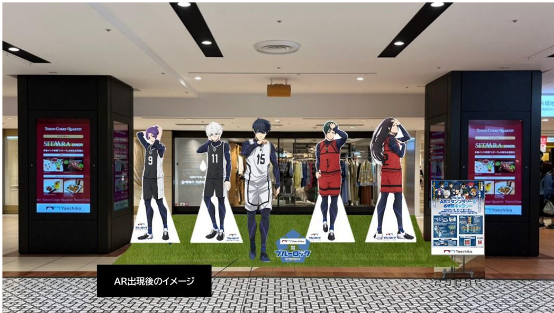
等身大パネルと AR 出現イメージ