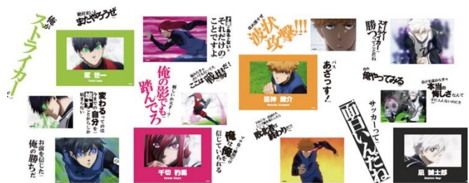
名場面ギャラリー イメージ