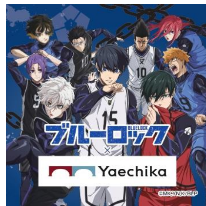
オリジナルステッカー